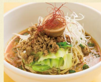
担々麺(温または冷) 1,200円