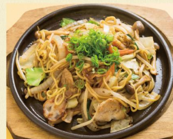
ソース焼きそば 1,200円