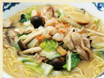
芸南チャンポン 1,280円 ミニチャンポン 1,130円