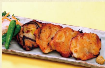
自家製さつまあげ 600円