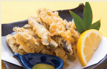
こいわしの天ぷら 650円