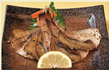
カレイの一夜干し 870円