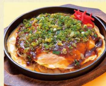
広島風お好み焼き 1,180円